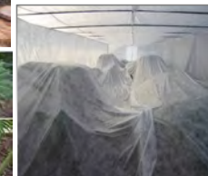
CYCADALES: 8 géneros (1,2 Ha)

Con varios representantes cultivados de 8 de los 11 géneros que han sobrevivido de aquella época.